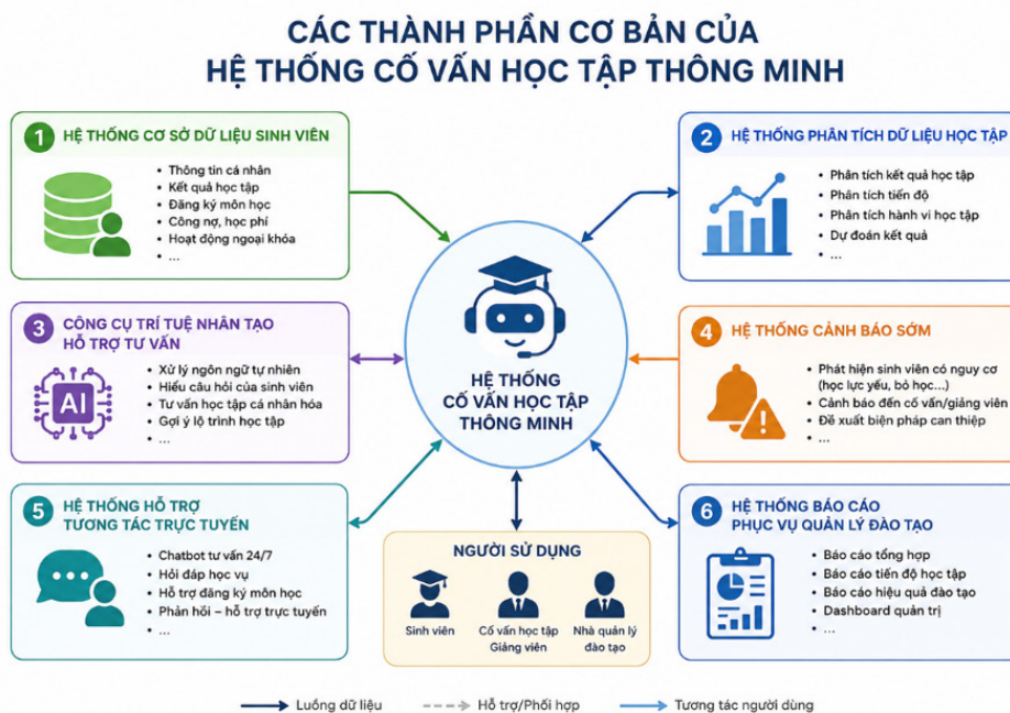
Hình 1. Các thành phần cơ bản của hệ thống cố vấn học tập thông minh

Việc ứng dụng AI trong cố vấn học tập giúp nâng cao tính cá thể hóa, tăng khả năng dự báo rủi ro học tập và tối ưu hóa quá trình hỗ trợ người học. Đồng thời, hệ thống còn góp phần nâng cao hiệu quả quản trị đại học trong bối cảnh chuyển đổi số.