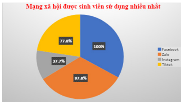
Biểu đồ 1. Mạng xã hội sinh viên thường sử dụng

Theo kết quả thống kê thu thập được của nhóm nghiên cứu, các nền tảng MXH được SV lựa chọn sử dụng phổ biến nhất bao gồm Facebook, Zalo, Instagram và Tiktok. Kết quả khảo sát của đề tài góp phần làm rõ hơn thực trạng lựa chọn và mức độ sử dụng MXH của SV sư phạm hiện nay.