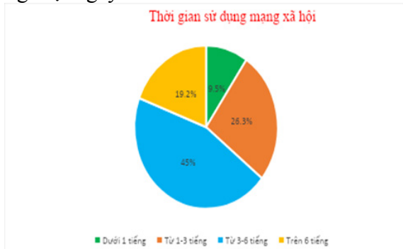
Biểu đồ 2: Thời gian sử dụng MXH trong một ngày của SV

Kết quả khảo sát của nhóm nghiên cứu phản ánh thời lượng trung bình mà SV sử dụng MXH trong một ngày.