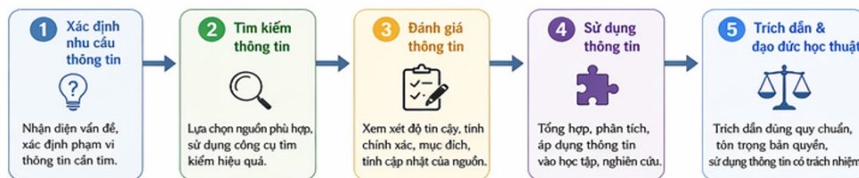
Hình 1. Mô hình phát triển năng lực thông tin cho sinh viên

Hiện nay, giáo dục thông tin ở nhiều trường đại học vẫn chủ yếu được triển khai như hoạt động hỗ trợ của TV, chưa trở thành nội dung đào tạo chính thức. Vì vậy, cần từng bước đưa giáo dục thông tin vào chương trình đào tạo thông qua các hình thức như xây dựng học phần độc lập, tích hợp trong các học phần phương pháp nghiên cứu hoặc tổ chức các chương trình bắt buộc dành cho SV năm nhất.