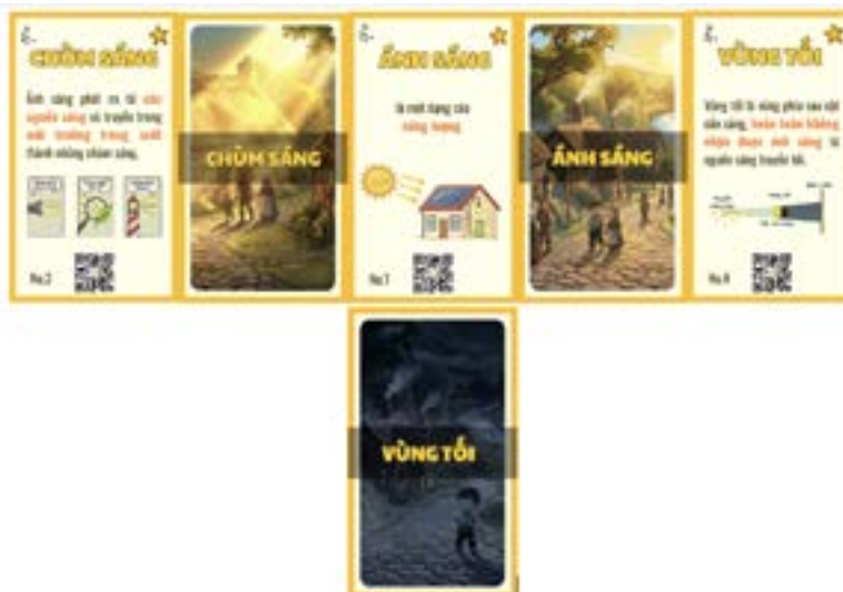
Hình 2. Các thẻ lý thuyết

Bộ thẻ Flashcard được xây dựng với ba thành phần cốt lõi gồm Nội dung, Yêu cầu và Đánh giá. Trong đó, Nội dung bao gồm hệ thống từ khóa và kiến thức cô đọng nhằm hỗ trợ học sinh chuyển từ ghi nhớ máy móc sang ghi nhớ có ý nghĩa, đồng thời chuẩn hóa vốn từ vựng khoa học và phát triển khả năng phân tích, tổng hợp thông tin. Yêu cầu được triển khai thông qua mã QR, dẫn dắt học sinh tham gia các nhiệm vụ học tập gắn với cốt truyện và được thiết kế theo các mức độ tư duy của thang Bloom. Hoạt động này góp phần kích thích hứng thú học tập, đáp ứng đa dạng phong cách học tập và tạo điều kiện để học sinh chủ động khám phá, củng cố kiến thức. Qua đó, giáo viên có thể đánh giá mức độ nhận thức khoa học tự nhiên của học sinh dựa trên thang Bloom. Các thành phần trên được cụ thể hóa thông qua thẻ lý thuyết (Hình 2) và thẻ câu hỏi gắn với bối cảnh thực tiễn (Hình 3), bảo đảm sự gắn kết giữa tri thức và yêu cầu vận dụng trong quá trình học tập.