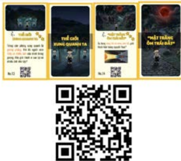
Hình 3. Các thẻ câu hỏi thực tiễn

Với cấu trúc nhiều thành phần, bộ thẻ hỗ trợ giáo viên tích hợp linh hoạt các phương pháp dạy học. Hình ảnh minh họa kết hợp với trang web cốt truyện trong mã QR có thể được sử dụng như học liệu gợi mở ở hoạt động Mở đầu, giúp kích thích tư duy của học sinh. Trong hoạt động Hình thành kiến thức mới, các khái niệm trọng tâm trên thẻ trở thành cơ sở cho thảo luận và khám phá kiến thức. Đồng thời, thông qua các trò chơi học tập và chuỗi nhiệm vụ tương tác, giáo viên có thể củng cố kiến thức, rèn luyện kỹ năng và đánh giá mức độ hiểu bài của học sinh. Nhờ đó, Flashcard không chỉ là học liệu hỗ trợ mà còn là công cụ dạy học linh hoạt, đáp ứng nhiều mục tiêu giáo dục và phù hợp với nhu cầu tổ chức dạy học của giáo viên.