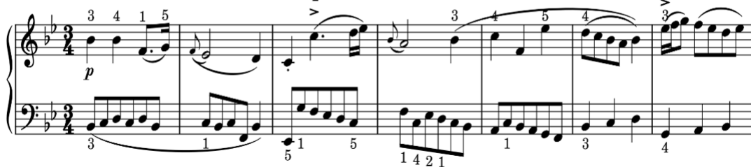
Vi dụ 3: Minuet B-dur BWV 118, facture chủ điệu đan xen phức điệu (Nhịp 1-7)

Trong các Minuet của J.S. Bach có nhiều kỹ thuật Piano cơ bản quan trọng của đàn Piano là legato (đàn liền tiếng), non-legato (đàn rời tiếng), staccato (đàn nảy tiếng). Legato (ký hiệu với một vòng cung liên kết nhiều nốt nhạc) được dùng trong các bản Minuet g-moll BWV 115, Minuet G-dur BWV 116, Minuet B-dur BWV 118 và Minuet d-moll BWV 132..., giúp cho giai điệu mềm mại, trữ tình. Staccato (ký hiệu có các dấu chấm trên nốt nhạc) được dùng trong các bản G-dur BWV 116, B-dur BWV 118... tạo cho âm nhạc vui tươi, sắc nét. Non-legato được sử dụng trong Minuet G-dur BWV 114, Minuet B-dur BWV 118... tạo âm hưởng hơi ngắt tiếng nhưng không sắc nhọn như kỹ thuật staccato.