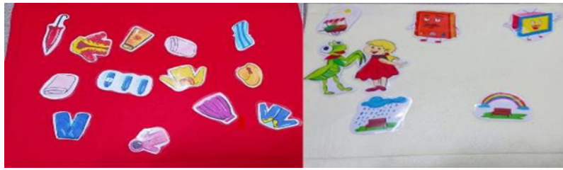
Một số dụng cụ cá nhân